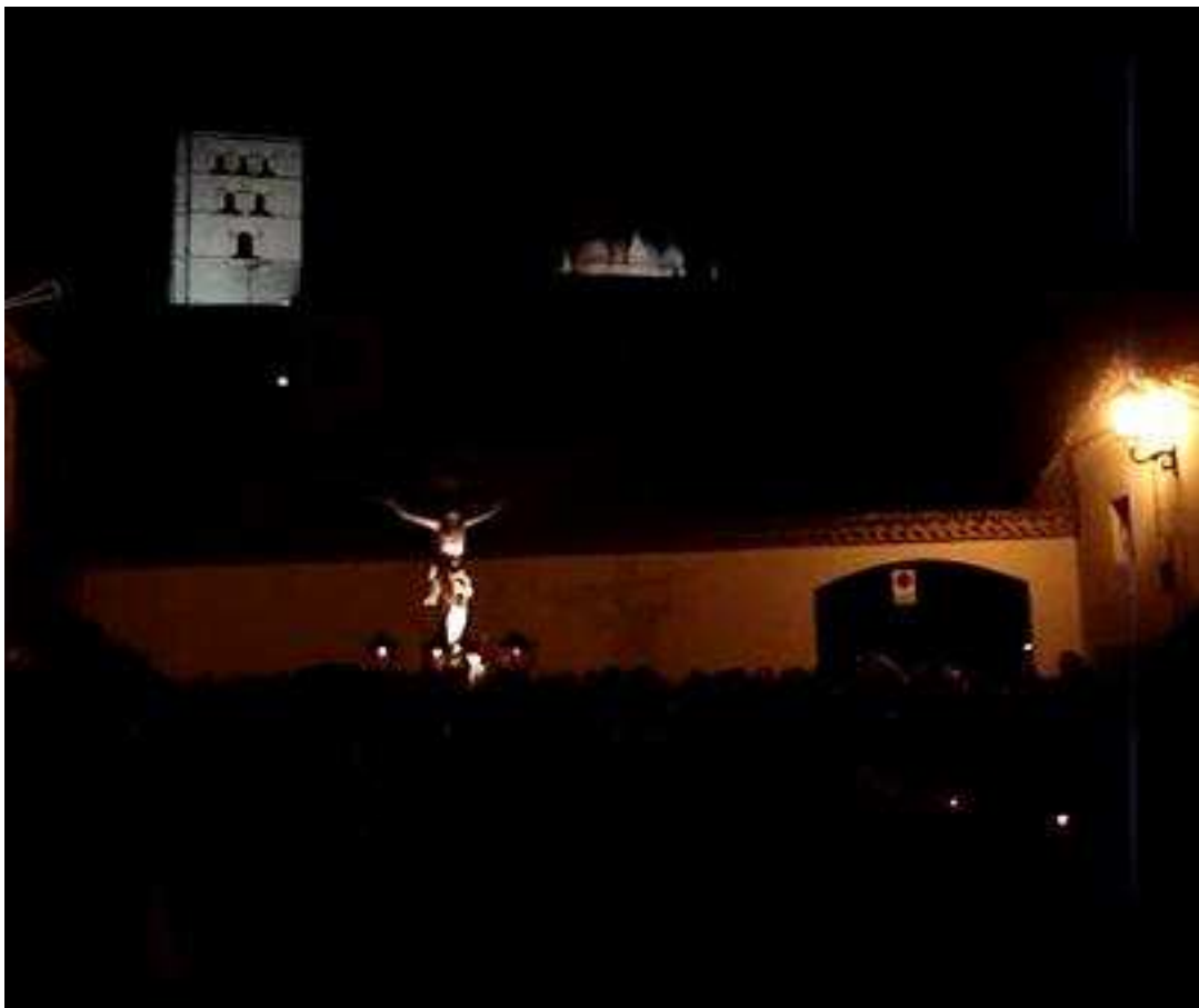
Procesión de las 'Capas Pardas' el Miércoles Santo en el barrio de Olivares, donde se entona el Miserere Alistano.

-El baile del " Cinco de Copas " al son de la Marcha Fúnebre de Thalberg en el interior de la iglesia de San Juan de Puerta Nueva el Viernes Santo.